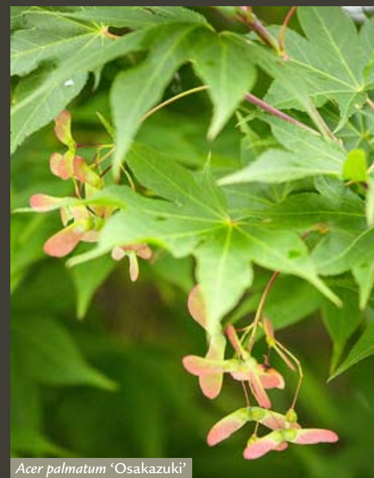
Acer palmatum 'Osakazuki'